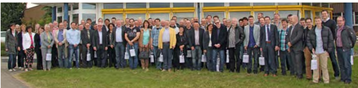
Die Teilnehmer der VdLB-Sommertagung vor dem SMB-Verwaltungsgebäude

„Mensch, war das schön bei Euch!“ - lautete die positive Resonanz des diesjährigen VdLB-Verbandstreffens Ende Juni, zu dem rund 60 Blechverarbeiter aus ganz Deutschland der Einladung der SMB Schneckenger GmbH nach Bad Dürkheim gefolgt waren. Neben einer Betriebsbesichtigung der Tuttlinger AESCULAP AG zeigten sich die Mitglieder des Verbands der Laseranwender Blechbearbeitung e.V. besonders beeindruckt von der interessanten Führung durch die hochautomatisierte SMB-Feinblechproduktion , bei der die SMB-Mitarbeiter in verschiedenen Präsentationen das hohe Niveau und die Verarbeitungsqualität der Blechbaugruppen des Feinblechtechnik-Spezialisten aus dem Schwarzwald unter Beweis stellen konnten. Und wie schon in der Vergangenheit hat es der VdLB auch in diesem Jahr wieder geschafft, das Angenehme mit dem Nützlichen zu verbinden - so kam die Geselligkeit während einer nostalgischen Dampflokomotive-Fahrt, der 'Sauschwänzle-bahn' auf historischer Strecke zwischen Blumberg und Weizen, sowie beim gemeinsamen Besuch des Rheinfalls in Schaffhausen nicht zu kurz.