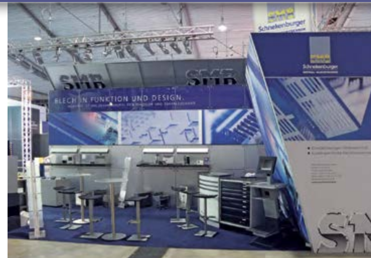
SMB Schnekenburger GmbH auf der Blechexpo 2013